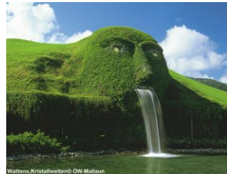
Wattens, Kristallwelten